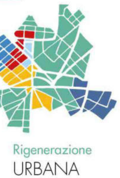
Tavola 2 Individuazione Ambiti su PUC

BANDO EX ART. 6 COMMA 1 DELLA L.R. 23/2018 Contributi per le attività di progettazione per l'individuazione e la disciplina degli ambiti urbani di cui all'articolo 2 della L.R. 23/2018 "Disposizioni per la rigenerazione urbana ed il recupero del territorio agricolo"